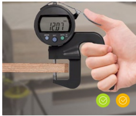
厚度公差 \pm 0.2\text{mm} *